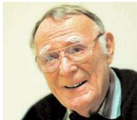
Основатель IKEA Ингвар Кампрад

Начав бизнес в 1943 году, IKEA выросла в глобальную сеть мебельных магазинов, построенную на единой концепции: «предлагать широкий ассортимент мебели и аксессуаров для дома хорошего дизайна и функциональности по ценам, доступным большинству людей».