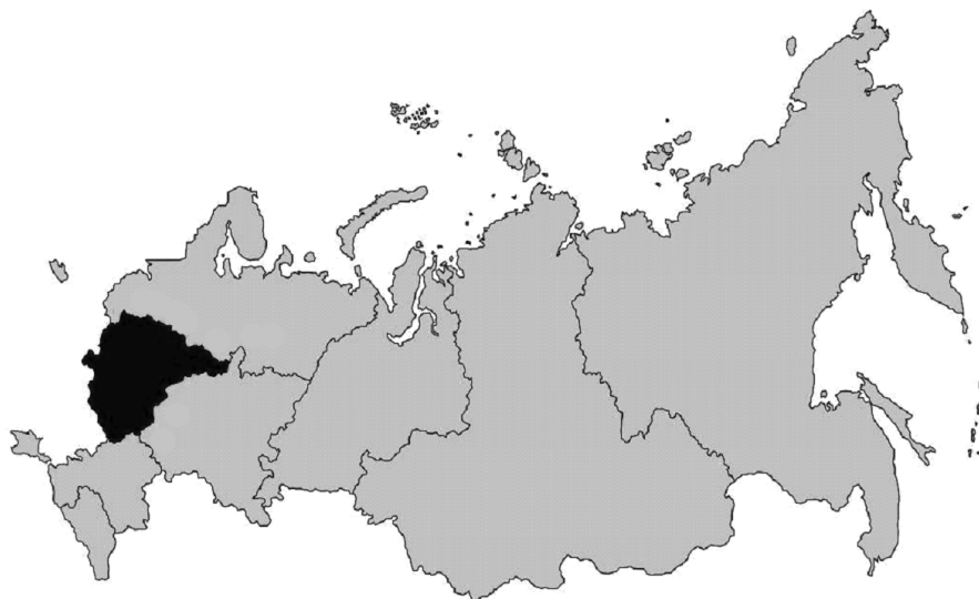
Карта 2. Русским — Русскую республику (лозунг и идея национал-радикалов)

онально-государственном размежевании, что, конечно, коснулось и европейского севера. Согласно условиям Тартуского мирного договора карелы должны были получить автономию, и для власти имело значение не то, нужна ли эта автономия самим карелам, а лишь то, кто и как будет создавать эту автономию, какие геополитические цели она должна будет решать. Что касается геополитических целей, то они были обозначены достаточно четко: карельская автономия должна стать плацдармом для предполагаемой большевистской экспансии в Скандинавию. Поэтому руководителями Карельской трудовой коммуны, созданной в 1920 г., вполне логично стали не карелы или вепсы, а финны, а точнее так называемые красные финны, которые потерпели поражение в 1918 г. во время гражданской войны в Финляндии, но мечтали о реванше. Неслучайно, что само название Коммуны (преобразованной уже в 1923 г. в автономную республику) имело на финском принципиально иное звучание ( Karjalan Työväenkommuuni — Трудовая коммуна Карелии), что создавало неадекватное представление о ее «карельскости». Показательно также и то, что «попытки создания карельской и вепсской письменности «красные финны» признавали шовинистическими, политически неверными и служившими для «одурачивания темных масс» [8].