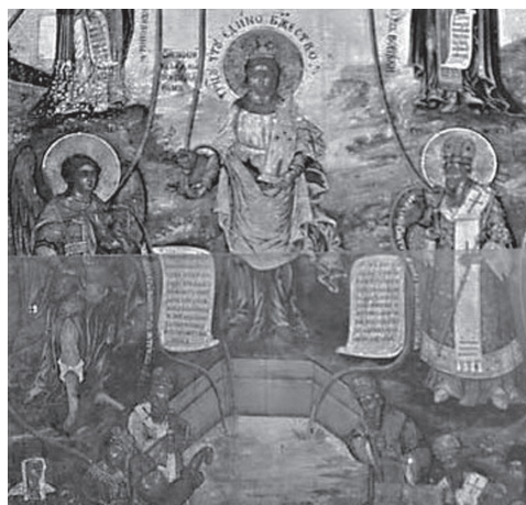
Рис. 8. Богоматерь «Живородный источник». Калуга, посл. четверть XVIII в. 114 × 67 см. Местный ряд иконостаса церкви Николы на Козинке, Калуга