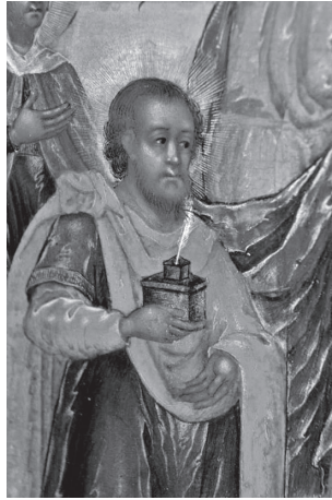
Рис. 4. Семейная икона калужских дворян Пирамидовых (фрагмент со святым Козьмою)