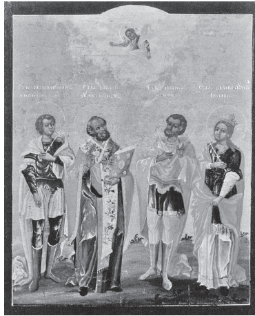
Рис. 6. Избранные святые. Дмитрий Яковлев Молчанов, 1734 г. 30,5 × 25,5 см. Собрание А.В. Анисимовой, Россия

[Нечаева, Чернов 2010, илл. 23, с. 34] (рис. 7), выделяющейся динамичными волнистыми драпировками одежд мученицы. Явным образом это направление в калужской иконописи оформится, по всей видимости, в последней четверти XVIII в. Близок в художественном отношении к иконе Пирамидовых другой памятник с бесспорно калужским происхождением – икона Богоматери «Живоносный источник» (рис. 8) из местного ряда иконостаса церкви Николая на Козинке, датируемая последней четвертью XVIII в. (до 1801 г.) 33 .