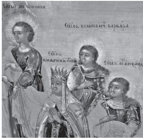
Рис. 3. Семейная икона калужских дворян Пирамидовых (фрагмент)

Обращает на себя внимание подчеркнутая диалогичность 18 поз святых апостолов: Лука изображен в профиль и открытым жестом обеих рук обращается к Филиппу. При этом, надо заметить, и в стихотворной подписи, и в живописном исполнении довольно ловко обыгрывается чин святости Луки как евангелиста ( греч. – благовестник), поскольку он изображается оратором. Филипп, расположенный в трехчетвертном повороте, как бы принимает послание своего собеседника, обратив открытую ладонь левой руки в его сторону, а правую прижимая к груди. Как можно догадаться, подобная