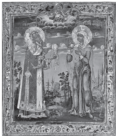
Рис. 7. Святитель Афанасий и мученица Татиана. Калуга, посл. четверть XVIII в. КМИИ