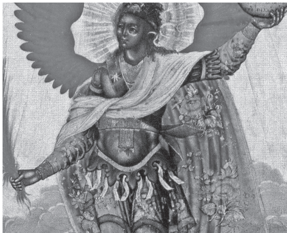
Рис. 10. Собор архангела Михаила. И. К. Карташов (фрагмент)

десятилетия, но по сути связанными с ней преемственностью стилистических признаков. Мы имеем в виду икону с изображением Покровского Лихвинского Доброго монастыря 35 (рис. 11), которую датируем примерно 1818–1832 годами 36 , а также образ мученицы