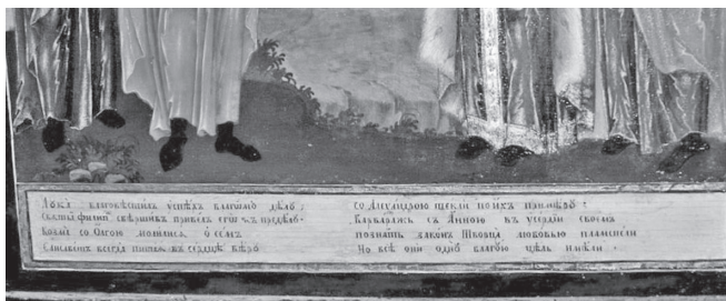
Рис. 2. Семейная икона калужских дворян Пирамидовых (фрагмент)