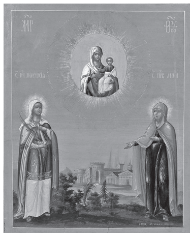
Рис. 12. Святая мученица Анастасия и праведная Анна с образом Богоматери Смоленской, 1829 г.

Центральный музей древнерусской культуры и искусства имени Андрея Рублева, КП-3420 Инв. № 2001-1