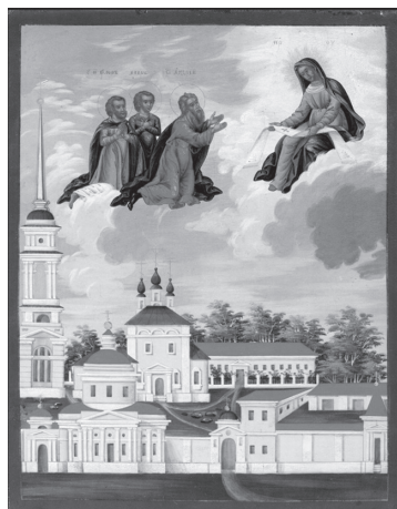
Рис. 11. Богоматерь с апостолом Андреем Первозванным и мучениками Флором и Лавром над Лихвинским Покровским Добрым монастырем.

Калужская губерния, 1818–1832 г. 22,5×17,8 см.