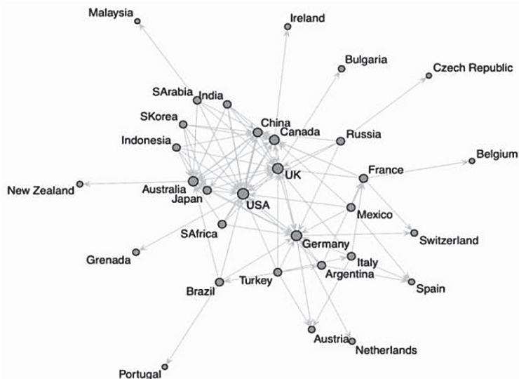
Рис. 1. Предпочтения в получении высшего образования за границей у студентов из государств G20

индикатору. Центральность по собственному значению усиливается при интенсивных связях с наиболее центральными странами – студенты из Индонезии, Южной Кореи, Индии, Китая и Японии предпочитают ехать в самые центральные по степени страны: США, Великобританию, Германию, Австралию и Канаду.