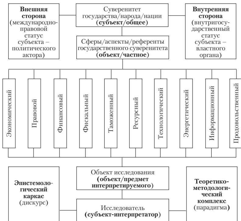
Рис. 1. Координация ответвлений суверенитета государства с профильными сферами его изучения. Составлено автором

Для визуального комфорта отразим субординацию видов государственного суверенитета, соотнесенных с профильными областями его компетентного изучения. Выстроенная на рис. 1 классификация выступит ассистентом в вопросе функциональной активности профильной области суверенитета (части), влияющего на фазовое состояние суверенитета государства (целого).