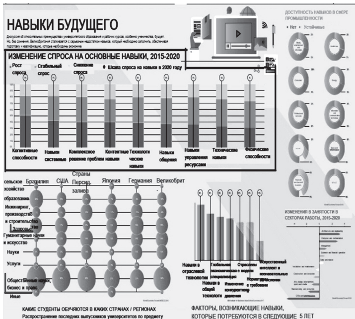
Рис. 2. Навыки будущего