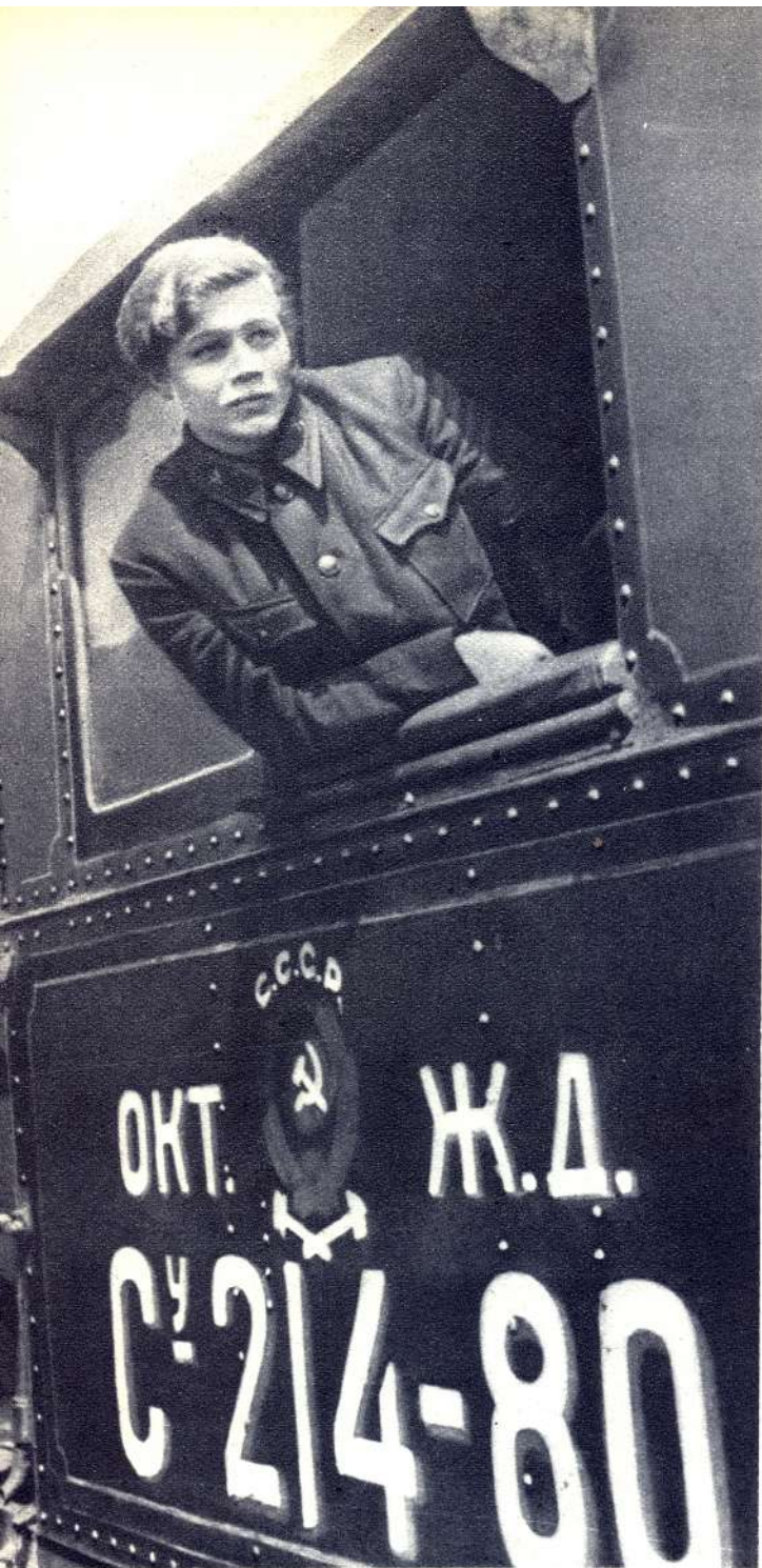
...кая железная дорога. ...луинец, Е. В. Кузнецова