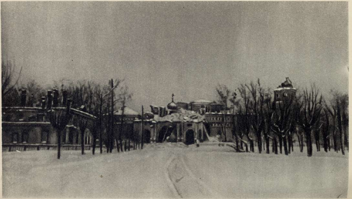
Новый Иерусалим — святыня Православной Церкви — варварски взорванной немцами