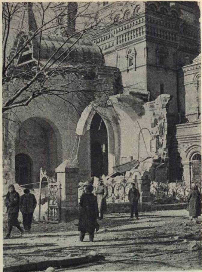
Разрушенный немецкими бомбами храм в г. Севастополе