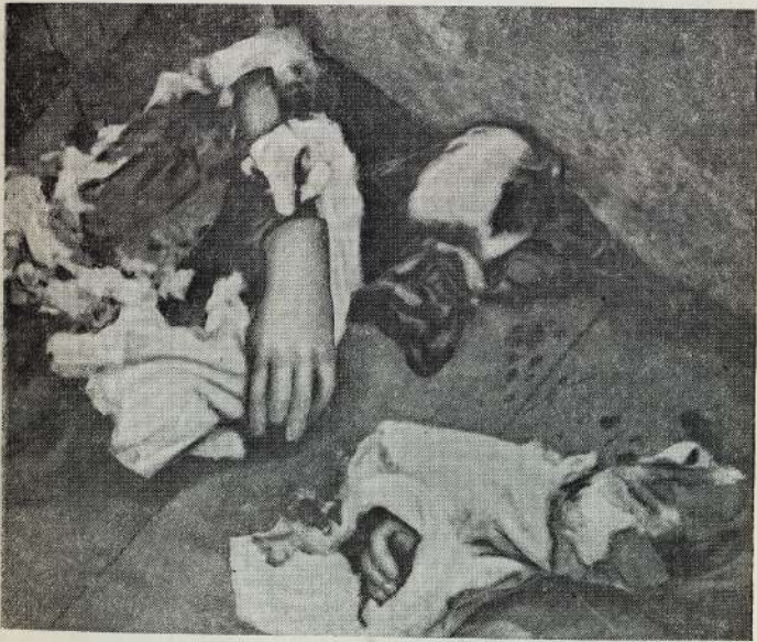
Застенок гестапо в г. Калуге. На полу лежат отрубленные и вырванные человеческие руки.