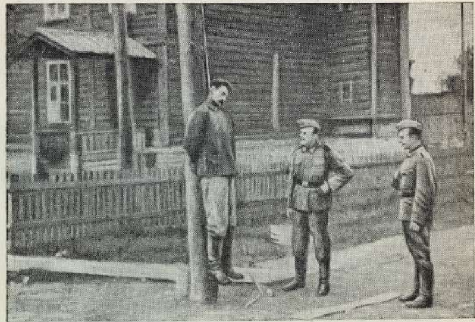
В одном из сел Ленинградской области немецкие фашисты повесили мирного советского жителя. Гитлеровцы любят дело своих рук. Этот снимок найден у немецкого солдата, захваченного в плен в селе Большое Вороново, Ленинградской области.