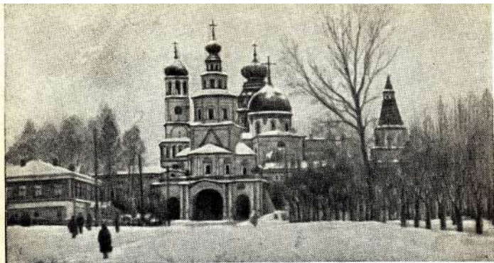
Истринский монастырь — «Новый Иерусалим», основанный в 1654 г. и реставрированный в XVIII веке великими архитекторами — Растрелли и Казаковым. Вид главного здания.

Главной достопримечательностью монастыря-музея является монументальный Воскресенский собор. Построенный по плану Иерусалимского храма, он, вместе с тем, служит образцом русской архитектуры эпохи расцвета московского барокко XVII века. Значение Ново-Иерусалимского монастыря определило и то внимание, которым он пользовался и в XVIII веке, когда к перестройке его был привлечен выдающийся архитектор Европы В. В. Растрелли. По его проекту крупнейшим московским архитектором Бланком были произведены капитальные работы, превратившие Воскресенский собор, особенно во внутренних частях, в первоклассный образец елизаветинского барокко. Центральная часть Воскресенского собора «кувуклия» (часовня над гробом господним), являвшаяся замечательным памятником древне-московского «ценнинного» (изразцового) искусства, была обстроена в XVIII в. по проекту Растрелли золоченым павильоном, по праву считающимся шедевром барочного декоративного стиля.