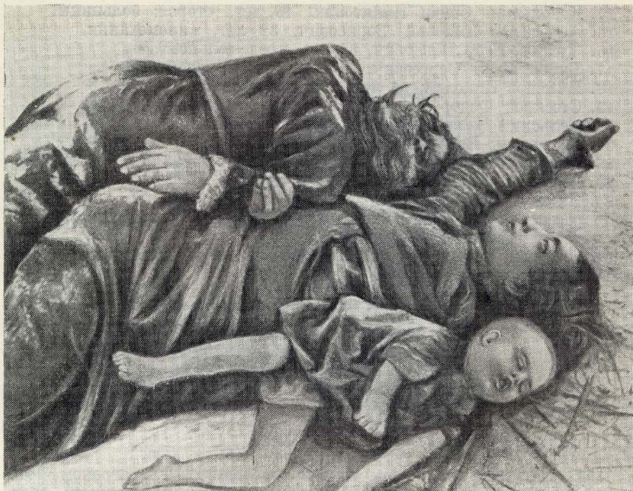
Семья колхозника селения Спас-Помазкино, Волоколамского района, Московской области, расстрелянная немецкими фашистами.