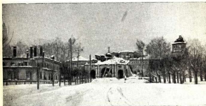
Немецкие фашисты взорвали главное здание Ново-Иерусалимского монастыря, замечательного памятника древне-русской архитектуры.

Другие здания монастыря, как церковные, так и гражданские, помимо своей архитектурной ценности замечательны тем, что связаны с выдающимися деятелями России, патриархом Никоном, царем Алексеем Михайловичем, Петром I, его тетрой, царевной Татьяной Михайловной и императрицей Елизаветой.